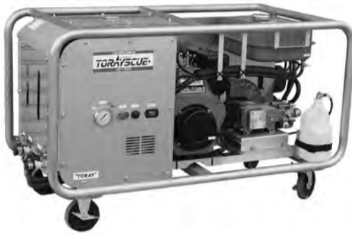
海水からも飲料水を造ることができる造水機『トレスキュー』

どの淡水はもちろん、海水からも飲料水を造ることが出来る画期的なシステムである。「食塩やトリ